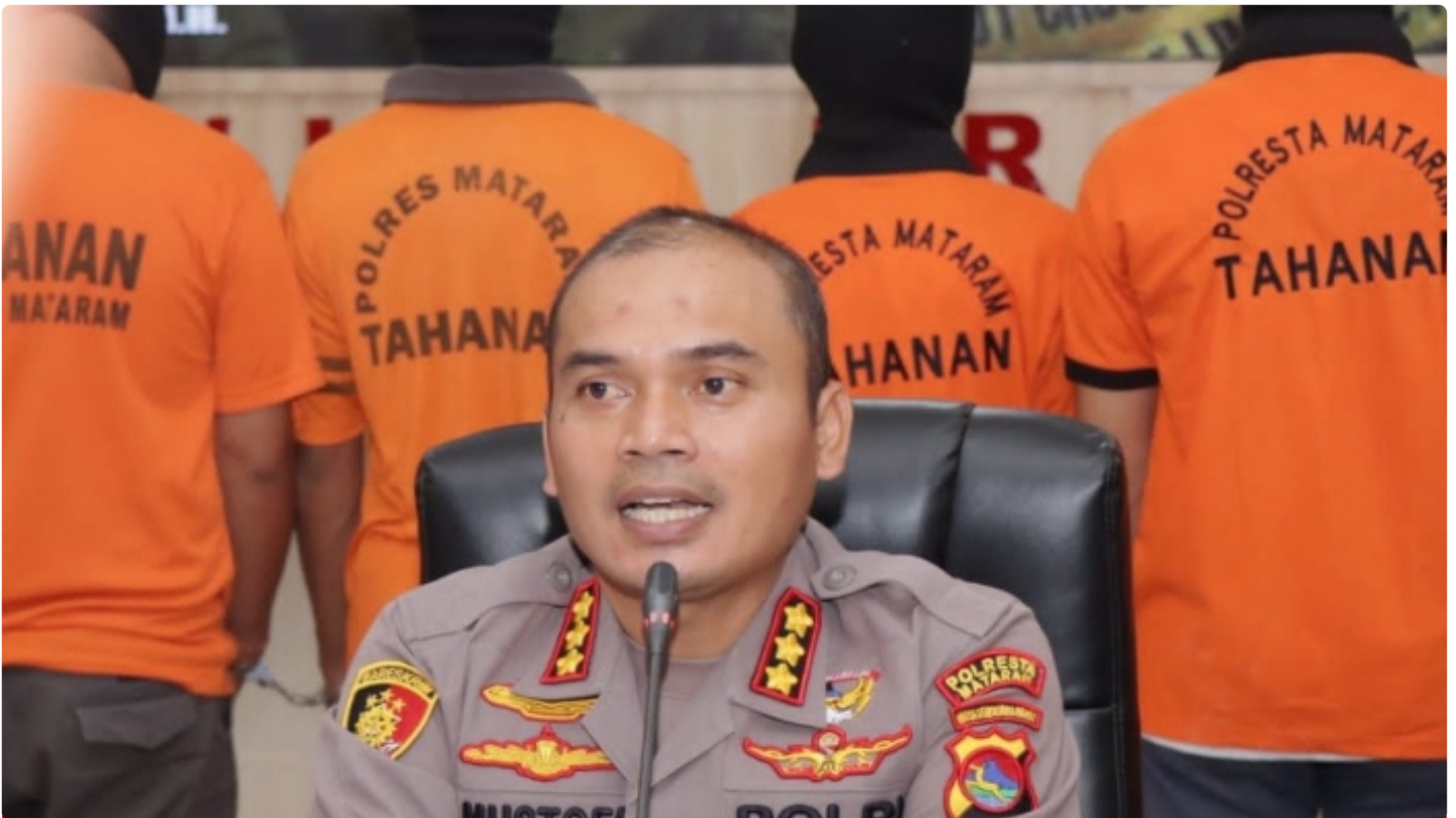
Kapolresta Mataram Kombes Pol Mustofa SIK MH saat konferensi pers, (05/12/2022)

Mataram NTB - Dalam Rangka memelihara situasi keamanan dan ketertiban masyarakat di wilayah Kota Mataram, Polresta Mataram Polda NTB melalui Sat Resnarkoba laksanakan Operasi menjelang Natal dan Tahun Baru (Nataru).